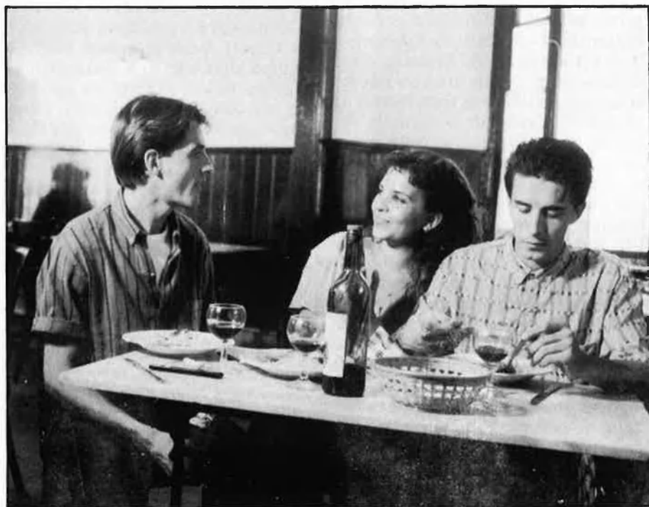
Una escena del film «Bar-ce-lo-na», de Ferran Llagostera.

Doncs bé, ja era hora... cinema català i en català. Com deia el Raimon a les acaballes dels seixanta, gràcies per haver vingut. □