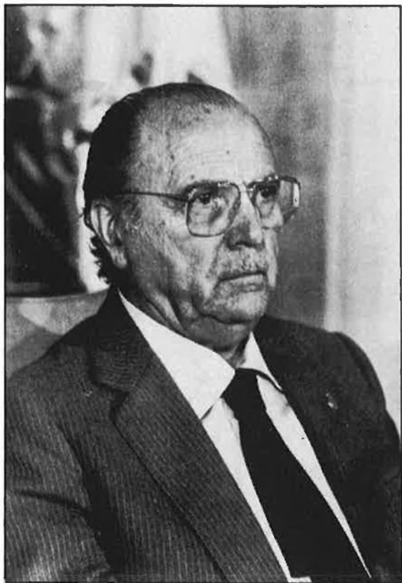
Fernández Albor: paraules mesurades i una cita.

D e dimecres 24 a diumenge 28 de setembre ha tingut lloc a Baiona (Galícia) el III Encontre d'escriptors bascos, gallecs i catalans, Galeusca. Els dos primers, a Poblet i a Sant Sebastià, havien deixat ben clars l'interès i la conveniència d'aquesta trobada de professionals, units, si més no, per treballar dins una marginació comuna.