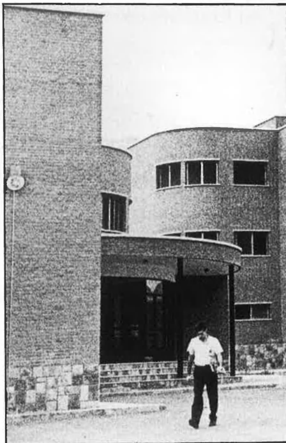
Són més que una minoria el clan dels funcionaris ultres.