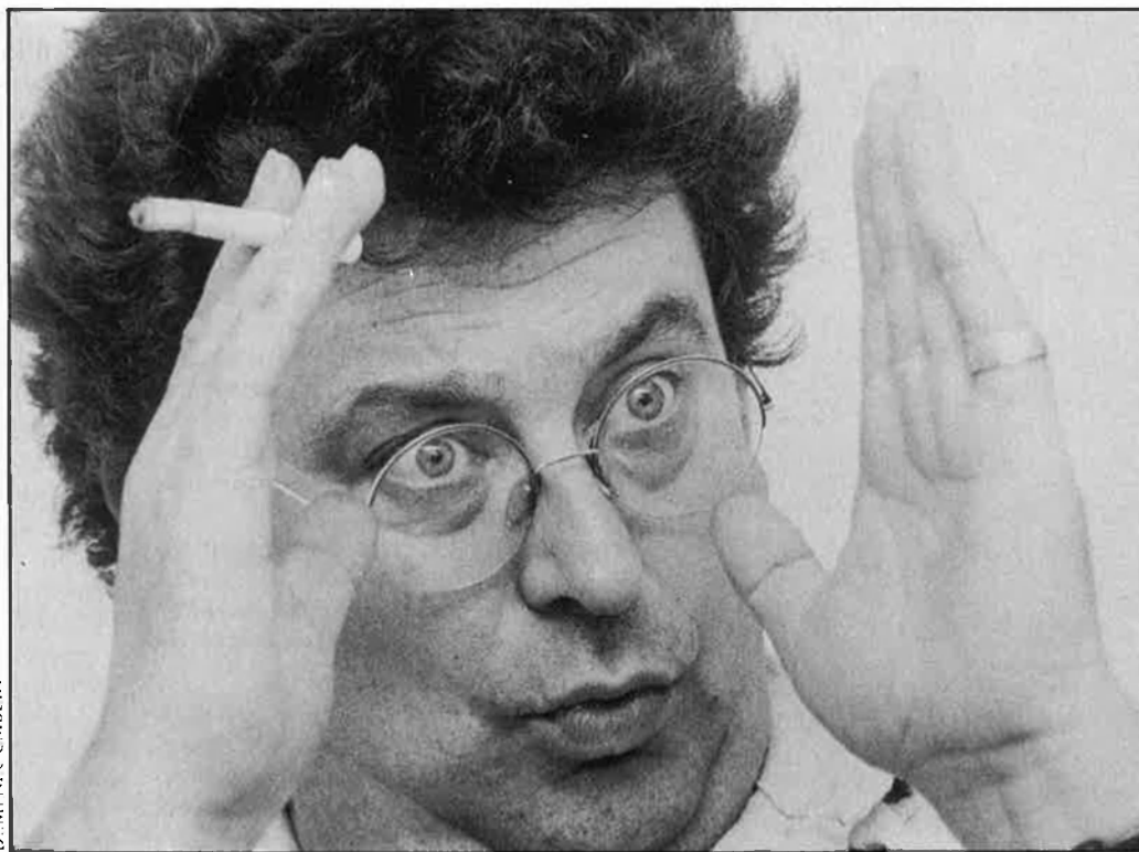
«Estem pels drets nacionals de Catalunya i per la unitat de la classe treballadora espanyola».

—No és veritat. La nostra trajectòria s'ha caracteritzat sempre per anar a favor dels drets nacionals de Catalunya, però tampoc no pensem tren-