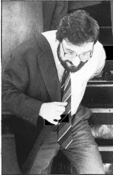
Narcís Serra, l'iniciador, i J. A. Samaranch, president del COI.

«No hi ha hagut debat entorn d'un tema tan fonamental. L'Oficina Olímpica s'ha negat en redó a participar en taules on estigué la Comissió. En aquests moments, l'Ajuntament té una cura exquisida a evitar qualsevol focus de conflicte una mica notable.