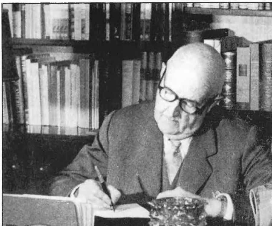
J. M. de Sagarra, al seu despatx.

Pels volts de la data que em vaig permetre el luxe indicat, vaig veure Josep Maria de Sagarra per darrera vegada. Jo entrava a la segona sessió del cinema Windsor de la Diagonal de Barcelona, un dels pocs cinemes naturalment elegants que he freqüentat, i ell sortia de la primera. Duia abric fosc, segurament blau marí, i barret ben segur. El recordo posant-se un moment la mà dreta a la butxaca i un peu calçat amb sabata impecablement enllustrada pujant un graó.