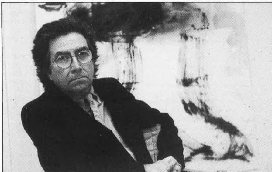
Antoni Tàpies, les obres del qual es presentaran pròximament a la Galeria Theo.