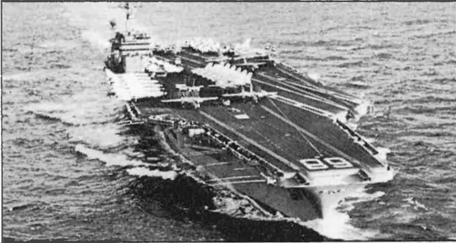
L'estat de tensió entre els blocs ha de baixar uns graus.

volum important serà notificada, inclús, amb dos anys d'antelació. I, tal com es comentava a Estocolm, «ningu no preveu començar la guerra un dia exacte d'ací a dos anys». L'estat d'alerta és lògic pensar que continuarà, però no el nerviosisme tens que podria desencadenar una guerra per equivocació.