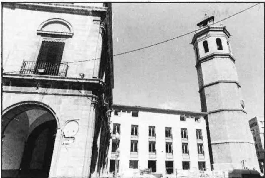
L'ajuntament, el Fadrí, la catedral... i el Banc de Santander.