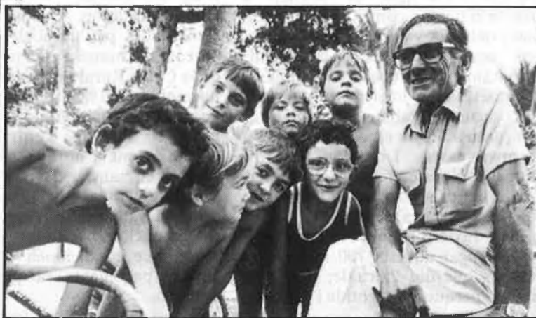
A l'esquerra, pintada a Gavarda. Baix, cases prefabricades de Beneixida i l'alcalde d'aquesta població.

construcció de la infraestructura secundària, l'edificació d'habitatges, els locals de negoci annexos i l'església.