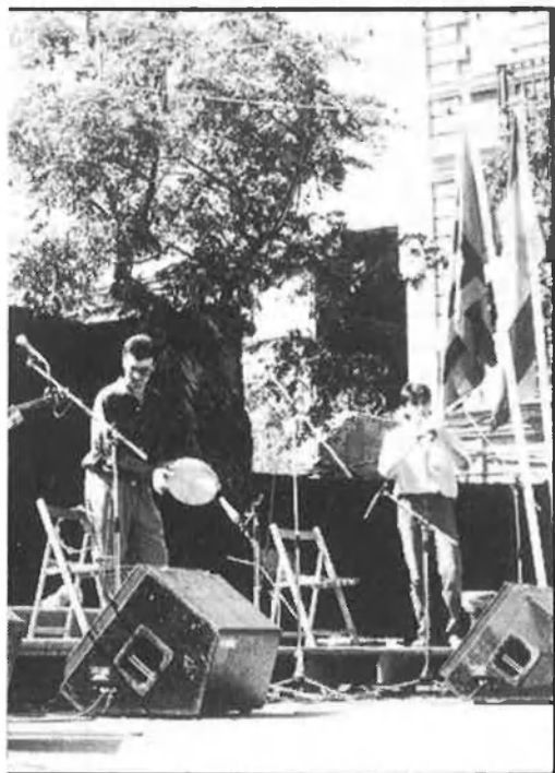
Calgija, Iota Bei, Mare Internum i

La darrera nit tingué més color. Com era d'esperar, els xicots de Rit-