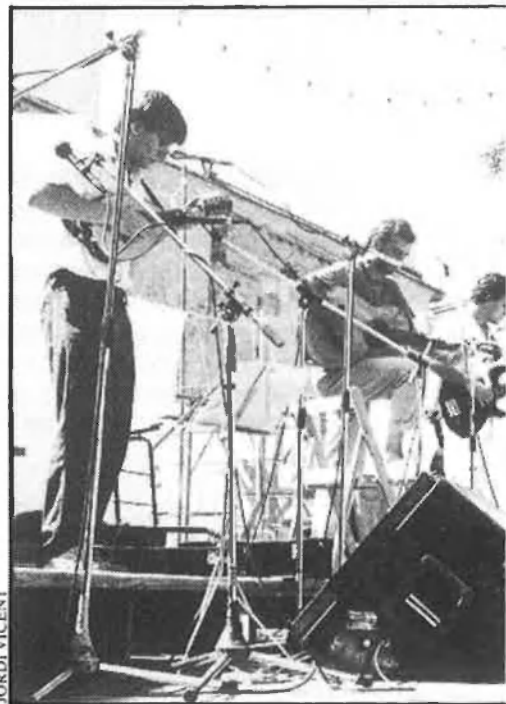
D'esquerra a dreta i de dalt a baix, Mare Interni Cànem.

cions es van haver de suspendre i els espectadors es van quedar amb un pam de nassos. Per raons diverses, l'organització no havia previst el trasllat a un local cobert en cas de pluja. Un altre any cal procurar que no plo-ga.