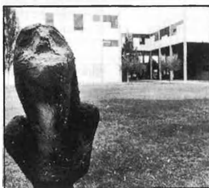
Alumnat de la Politècnica: massa tensions.

I, mentrestant, la sensació que la vida passa pel teu costat sense que te n'adones. «No tens temps de llegir, les relacions personals van reduint-se a l'àmbit dels companys d'estudis, tan atrafegats com tu, i arriba un moment en què, si et pares a pensar, arri-