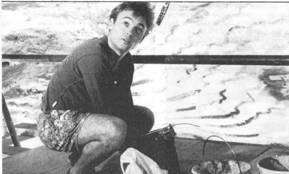
«Pintar és com mirar a l'infinit».

—Sí, sí, són bastant simples. Crec que van reestructurar el teatre i van pensar que algú podia pintar la cúpula de l'entrada. M'ho van dir, vaig venir a veure-ho, em va agradar la idea.