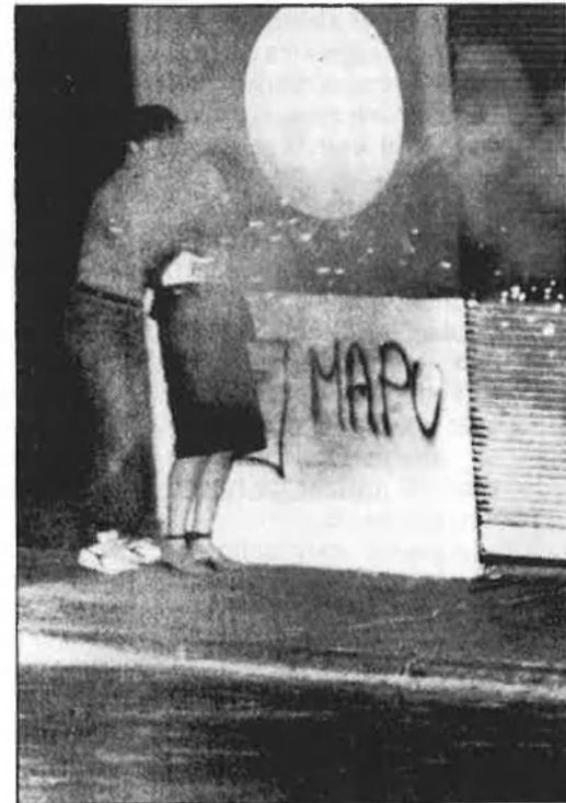
«Cal no ser ingenus: Pinochet s'hauria inventat cetar la repressió».

— ¿I, doncs, quina és l'estructura de la vostra organització?