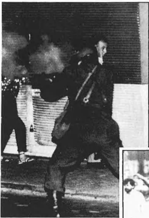
atemptat a fi d'en-

Encaixem les mans. Em diu que suposa que ens trobarem alguna altra vegada. Espere que sí. I que serà a Santiago de Xile. □