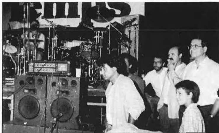
Conseller i autoritats.