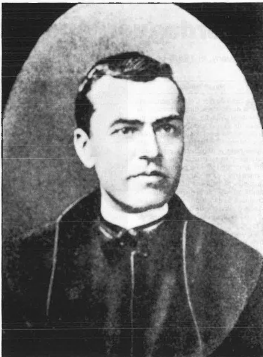
Cent anys després, llum sobre Verdaguer

to s'inicia —de bona fe, segurament— en la pràctica d'exorcismes.