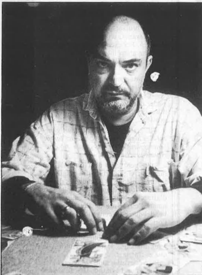
«El vampirisme psíquic és molt més freqüent del que la gent es pensa.»

multàniament el tarot, la quiromància, la telepatia i la vidència, a través de les vibracions que rebo de la persona que tinc davant. Hi ha gent que, aquestes vibracions, les fa visibles (almenys per a mi), és el que es coneix per «aura», i n'hi ha que no. La majoria de les vegades no em cal les cartes per endevinar res, perquè en aquestes vibracions, en aquesta energia, la persona transporta tot el que