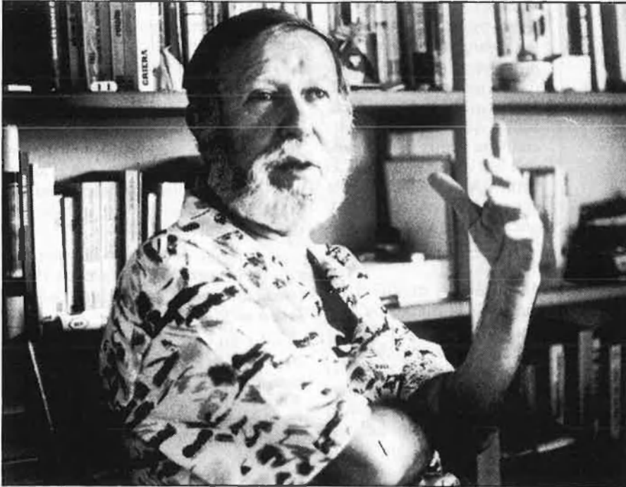
«Inclús els partits d'esquerra tenen por de parlar de revolució».

Hay una juventud que aguarda, La ciudad cambia su nombre, un escàndol allà al 1964, o Els altres catalans, són llibres que ara recorda, de la quarantena que n'ha escrit. Fa poc, n'ha acabat un de contes, de quaranta relats, titulat El juramento . «Em falta passar a net algunes pàgines», explica. Segurament, el tindrà llest aquest mateix setembre i es publicarà d'aquí a tres o quatre mesos, a l'editorial Plaza i Janés. El deixem, doncs, perquè pugui acabar el seu treball, entre llibres i blocs de ciment, entre l'emoció humana i el desencís per la misèria quotidiana que dissecciona amb els seus ulls murrís i lleugerament oblics. A fora, el dia s'ha ennuvolat i el sol no pica tant. □