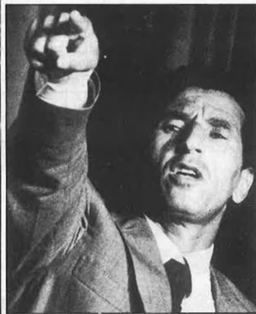
Abdel Salam Yalud és l'home cridat a substituir Gaddafi.

Un emissari de Hassan II sembla que va viatjar, en el màxim secret, a Washington per afirmar que el rei «pacíficaria i domaria Gaddafi». Els dubtes de l'administració Reagan, però, s'han mantingut durant aquests