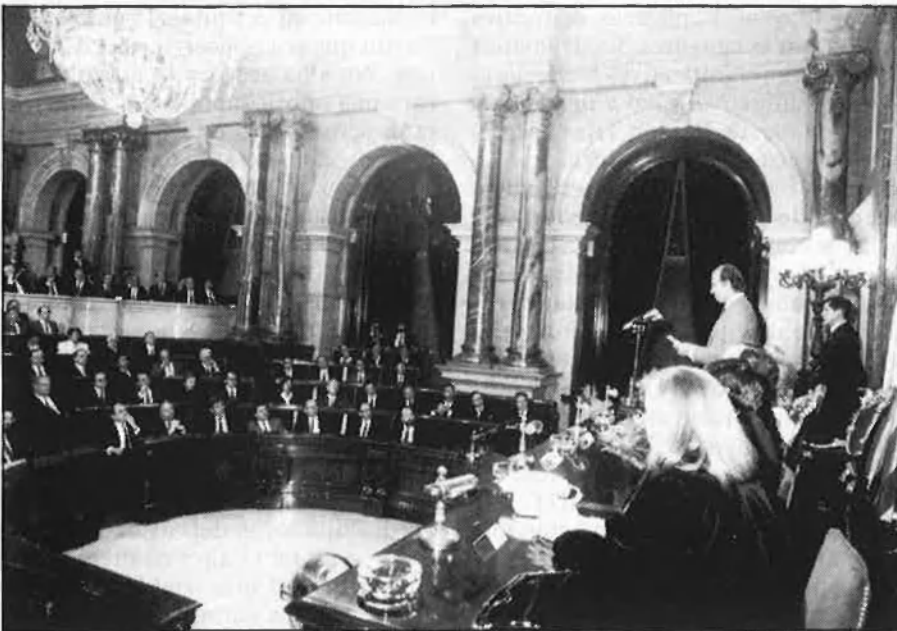
Visita del rei Joan Carles al Parlament de Catalunya.

González aprofità aquells dies per a passejar amb barca per Escandinàvia