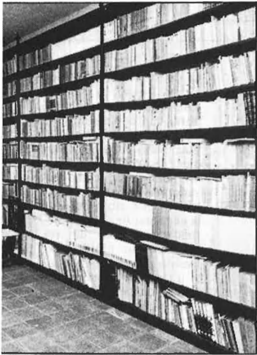
Dalt, la biblioteca. Baix, pati de la casa.

la donació de la biblioteca particular de l'erudit a la institució. Operacions.