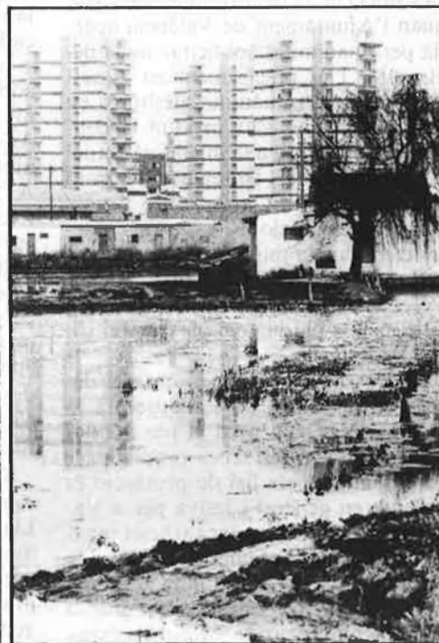
Un paratge que s'ha arribat a considerar irrecuperable.

dicions de degradació a què es troba sotmés.