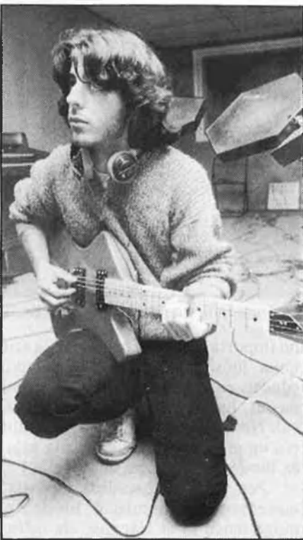
Dalt, Pantaix; a la dreta, Ample Temple.