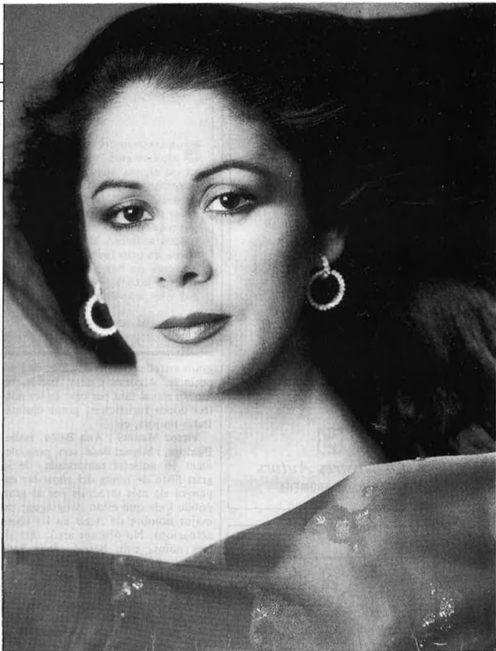
La Pantoja, viuda i olé d'Espanya. Baix, Víctor Belén i Ana Manuel.

Tècnics, músics, pipes, ajudants, secretaris, esposes, amants i mamàs