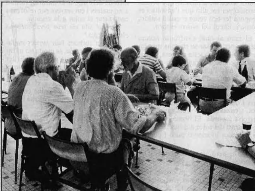
Un lloc de reunió de la gent dels Països Catalans que creu en els Països Catalans.

Però, tot i això, no n'hi ha prou. En el passat, l'UCE va ser important per als catalans que vivien la dictadura feixista; avui és primordial per als que vivim sota el jou de l'ocupació francesa. Cal continuar l'esforç dels dos costats, perquè tots junts ens puguem beneficiar d'aquest focus de cultura i de ciència i perquè a Prada cap frontera no existeixi. □