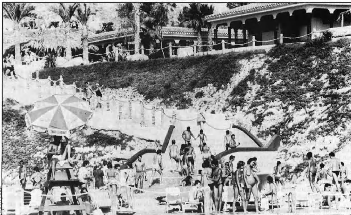
UNA VISITA A AQUALAND-BENIDORM