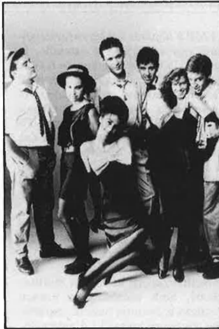
Objectivo Birmania, un grup de la «movida», molt promoguda en les nostres fires.