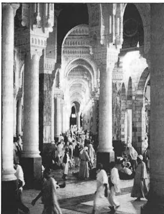
Quasi un milió, sense distincions.

Les xifres de pelegrins que realitzen enguany el viatge han estat relativament inferiors a la d'altres anys. De