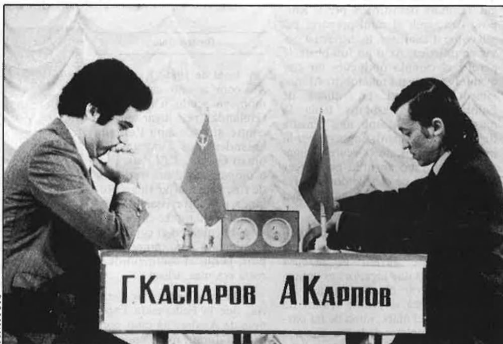
El passat 28 de julio començà a Londres el matx de revenja.

rant curiosament l'important matx de revenja.