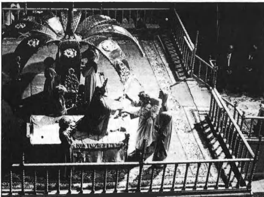
UNA CITA INELUDIBLE