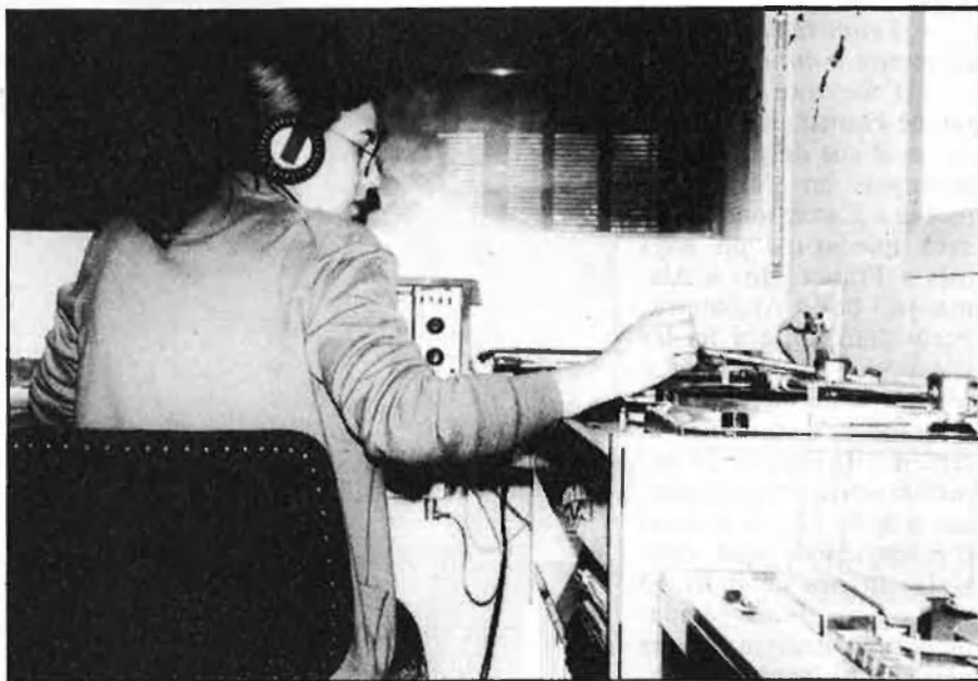
Reorganitzar la Freqüència Modulada, l'objectiu —conflictiu— de la Generalitat.

a comptar amb una emissora. A l'hora d'estudiar la forma més adient de legalitzar aquest col·lectiu, cal pensar que Catalunya té més de 900 poblacions i, en teoria, un bon percentatge poden aspirar a tenir una ràdio.