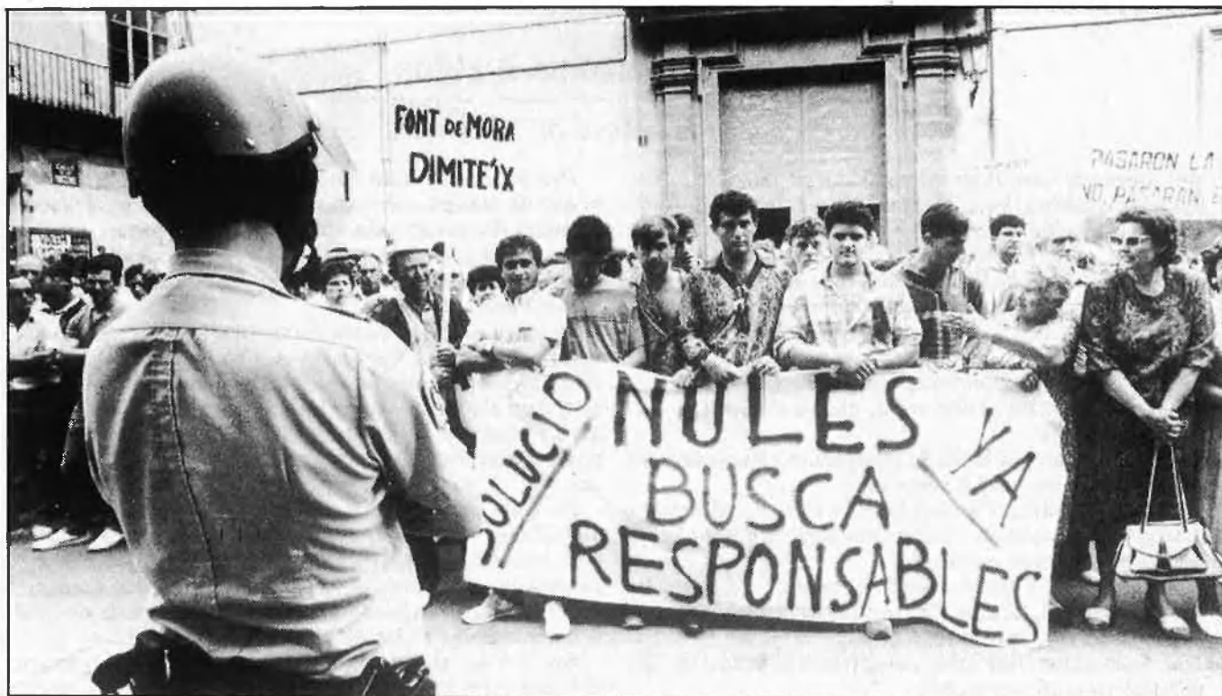
ELS AGRICULTORS VALENCIANS RECLAMEN EL TRANSVASAMENT