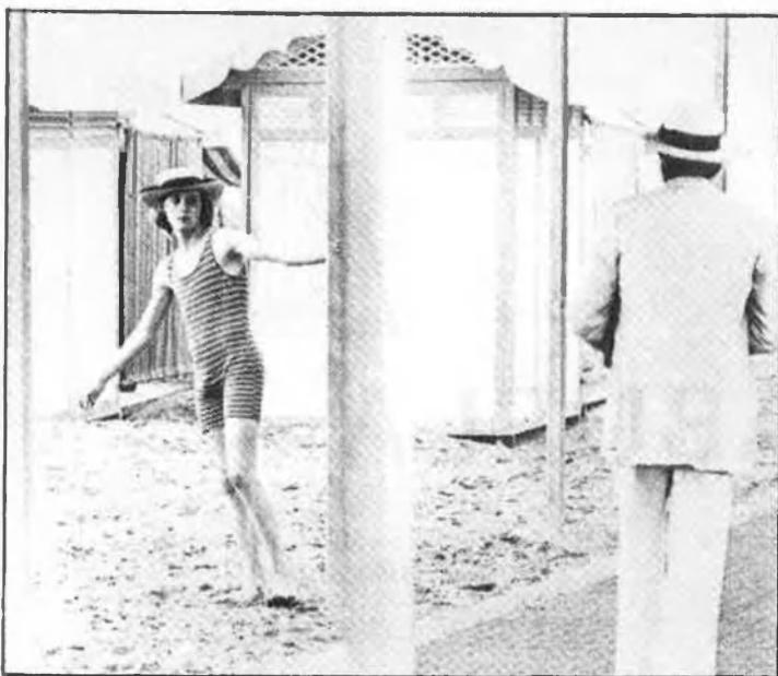
A l'esquerra de dalt a baix: «Hatari». «En busca del amor», «Atrapa a un ladrón» i «Dos semanas en otra ciudad». A la dreta, de dalt a baix, «Vacaciones en Roma» i «Muerte en Venecia».