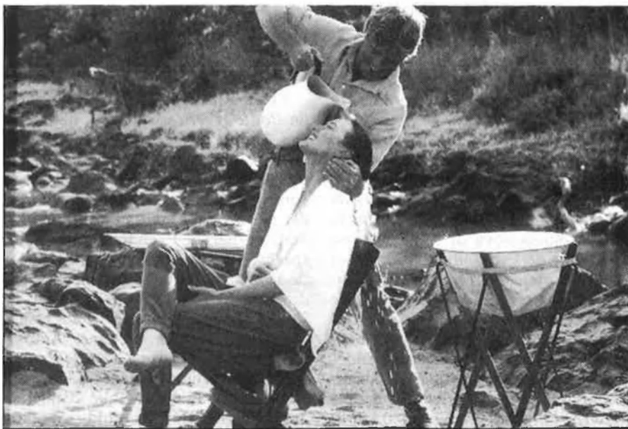
Redford refresca Streep en una escena de «Memorias de Africa».

German Lorente , o Bahía de Palma , de Juan Bosch , am l'ex-miss Viaggio , Elke Sommers .