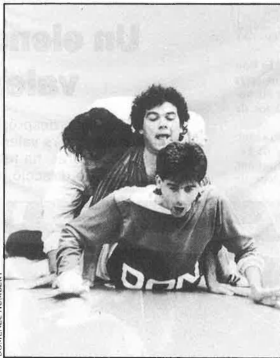
Una orgia frenètica, tallada per sant Vicent Ferrer.

La parella, és clar, ¿per què no?, és valenciana, exactament, de Favara, el paradís emplaçat entre el Tigris i l'Èufrates. Pequen, però, en collir, contra la prohibició expressa del Pare, una taronja. L'àngel que fa al cas els expulsa de Favara, encara que té la delicadesa d'enviar-los a Favareta, terra pròdiga i amb prou amenitats per recordar-los el paradís perdut: «Entre el seny (l'Ebre), i el sarau (el Segura), tindreu la vostra descendència», els anuncia.