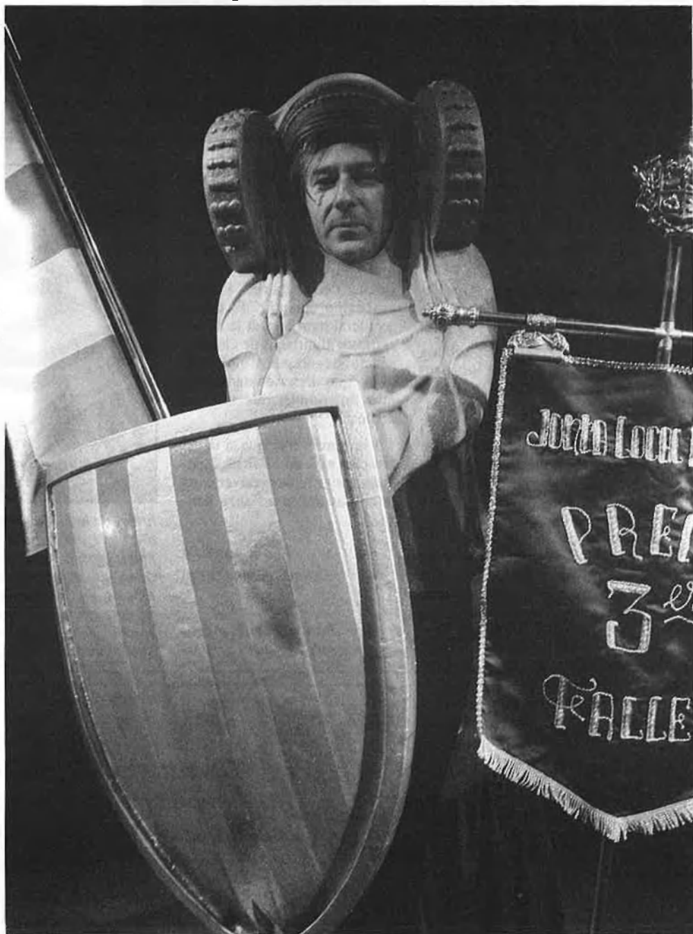
«La religiositat dels valencians és summament pagana».

és fer un manifest dient: m'agrada aquest país, i com que m'agrada, he acceptat de fer aquest espectacle. Naturalment, si no m'agradés, en faria un fotent-los canya; mai no aquesta apologia dels valencians que vol ser Vicenteta de Favara , o l'entrada dels russos a la capital de França .