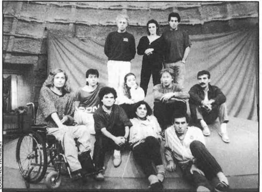
«Són actors molt bons, amb molta força en les accions tel·lúriques».

estupendament amb els actors valencians que fan l'obra. És de dements negar aquesta evidència. O potser sí que en tenim, de do de llengües, nosaltres també. Estic disposat a dir, si es vol, que jo parlo valencià del nord, no tinc cap inconvenient. La qüestió de noms no m'importa gaire: diguem-li