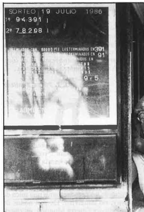
Loterias, la punta de l'iceberg.

Certs càrrecs comarcals i provincials del PSOE podien estar contents del seu èxit. Sobretot al Baix Segura, on s'ha centrat tota la corruptela. I on s'han concedit administracions de loteria, no tan sols a familiars o persones properes, sinó també a responsables públics, malgrat que l'article 155 del reglament de Loteries estableix que «aquests darrers no poden ser titulars ni gestionar aquestes administracions», i que el 176 els obliga a «re-