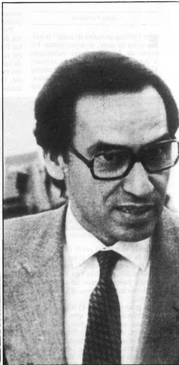
Un nou govern, i un nou equilibri entre les famílies del PSOE.