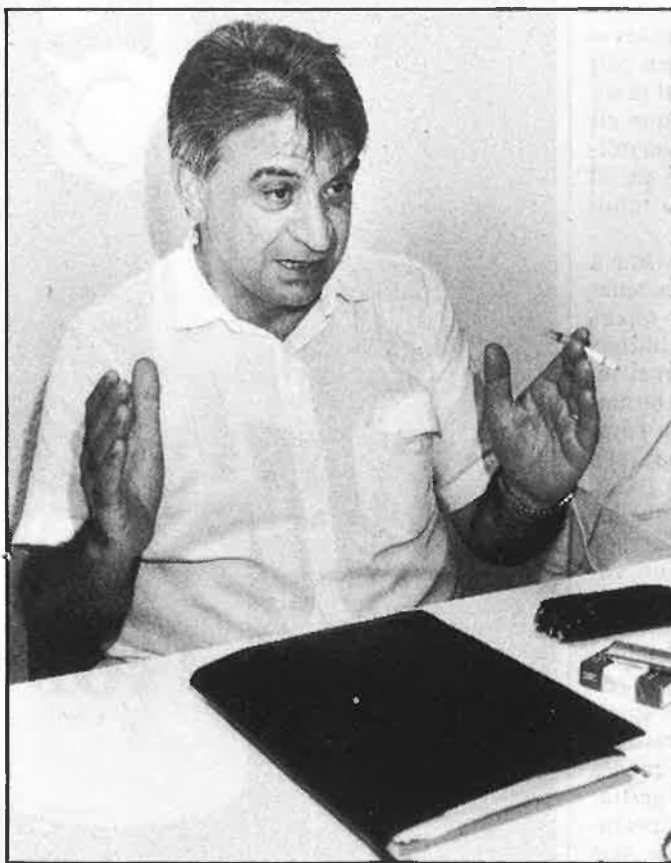
«La unificació lingüística es fa malbé quan té una càrrega política».

realitat del poble, que li és desconeguda totalment. I això és una realitat que sociològicament no es pot rebutjar. Sociològicament, crec que hi ha un retard, un retard que s'ha de considerar, que no es pot forçar.