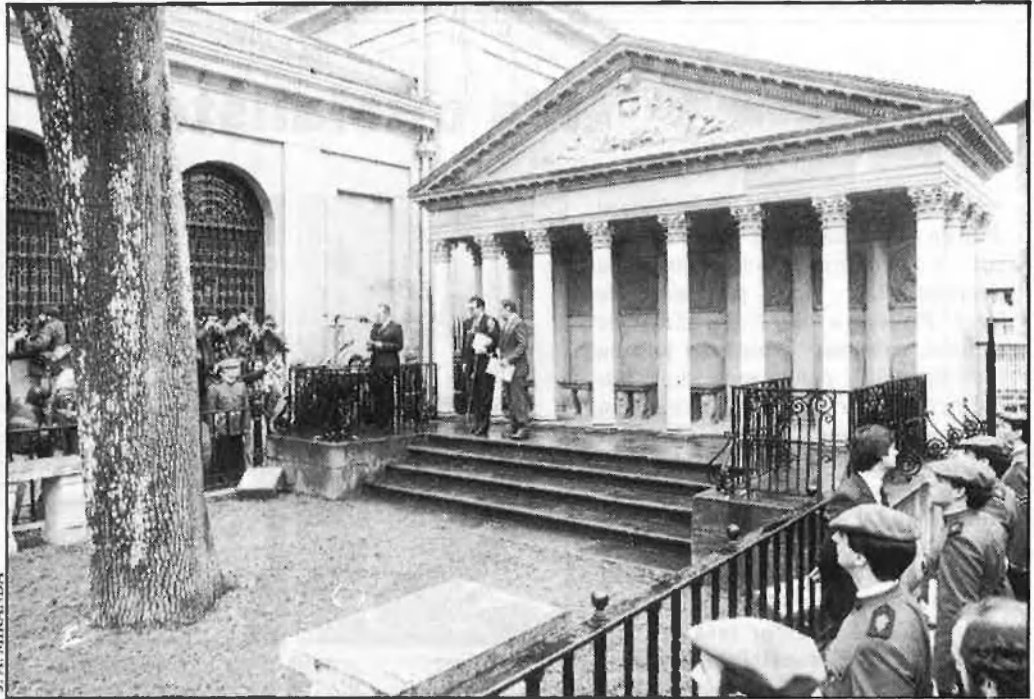
A l'esquerra, Garaikoetxea i Arzallus, en uns altres temps. A la dreta, el president Ardanza, davant l'arbre de Gernica. Baix, un «batzoki».

El segon esglaó, en l'estructura interna del PNB, són les Organitzacions regionals , que corresponen a cadascun dels territoris històrics o províncies d'Euskadi: Biscaia, Guipúscoa,