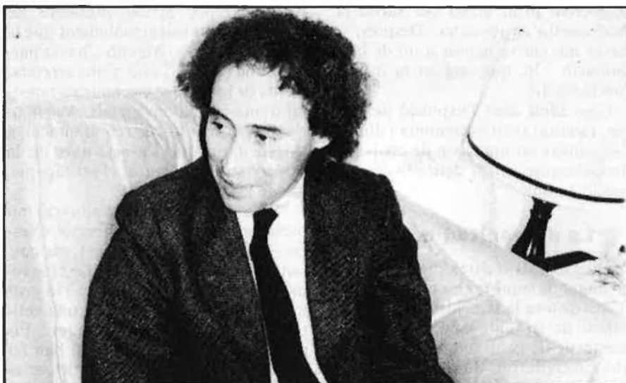
La Generalitat, l'última «farmàcia».

prestacions, que podrien consistir en la utilització conjunta de locals, en la realització d'activitats culturals, etc. Això permetria a l'Ateneu disposar d'uns ingressos que ajudarien a superar la situació, d'una banda; i de l'altra, reviscolar l'entitat i dinamitzar-ne la programació».