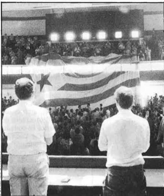
«Enfortir el moviment d'alliberament nacional».

La IV assemblea general de la Crida va aprovar i ratificar, quasi per unanimitat, totes les propostes dels ponents. Les prop de 1.200 persones que omplien el Palau de Congressos de Barcelona van acordar mantenir l'estratègia política de l'entitat i l'estil d'actuació. Un estil que continuarà basant-se en les mobilitzacions populars, acompanyades de negociacions. En cas que les negociacions fallin, la Crida