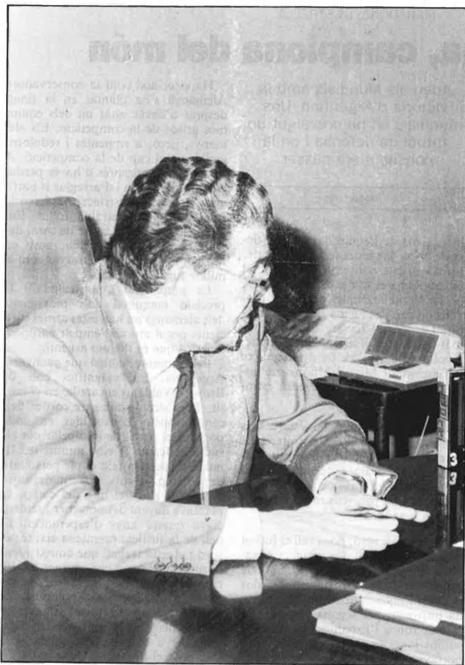
«Hem d'anar amb les nostres sigles a les eleccions».

eleccions o a qualsevol tipus d'acció futura. No podem de cap de les maneres esser ara PRD, demà UM o passat-demà una altra cosa. Hem de tornar als nostres orígens, als nostres objectius fundacionals del partit, i hem d'anar amb la cara ben alta dient que som UM. Això no lleva que no puguem estar federats amb qui vulguem, però qui es presenta a les eleccions és el nostre partit, el que defensa allò nostre, perquè els mallorquins volem UM i, per tant, l'hem de defensar deixant per a un futur qualsevol tipus de vinculació, però sempre des d'UM.