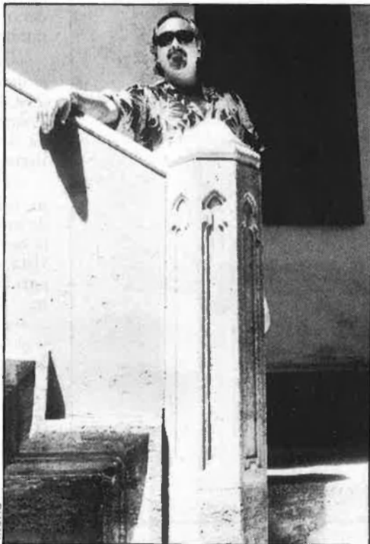
«Em van pagar un milió dels d'abans».

—No m'ho han aclarit mai. El va comprar Edigsa, pagant moltíssims diners, un milió d'aleshores. Quasi de seguida, però, començaren els problemes a Edigsa, hi hagué una commoció a l'empresa, a causa d'una malversa-