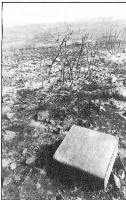
«Plorar de ràbia i d'impotència».

Visitar la Serra d'Espadà, quasi cinc anys després del gran incendi que hi destruï prop de 5.000 hectàrees de bosc, és, «a priori», tornar a l'escenari d'un infern. «Era hivern, feia tan de vent i es va escampar tant el foc