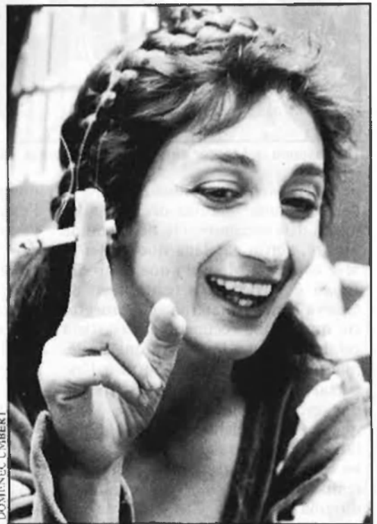
A l'esquerra, Comediants, amb «Alé». A la dreta, Sílvia Munt, en «Romeo i Julieta».