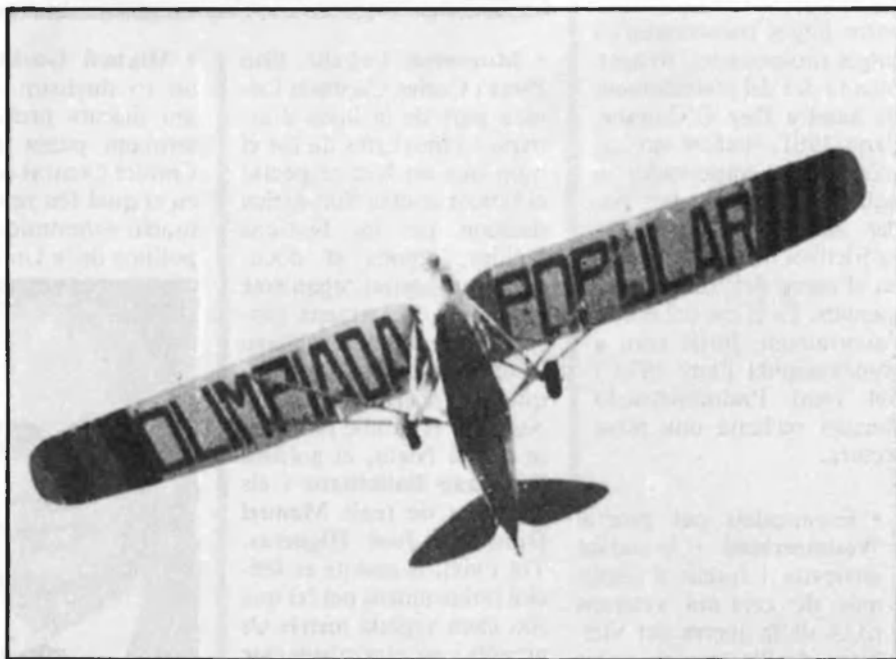
Publicitat aèria de l'Olimpíada.

Unes vint mil persones, entre participants i assistents, havien arribat a Barcelona els dies anteriors. En tan sols tres menes, la ciutat s'havia esforçat per organitzar la Setmana d'Esport i Folklore o l'Olimpíada Popular, que tindria lloc del 19 al 26 de juliol. Joves obrers de diferents països havien vingut atrets per l'oferta esportiva i política dels Jocs. Tots coincidien en un punt: el seu antifei-