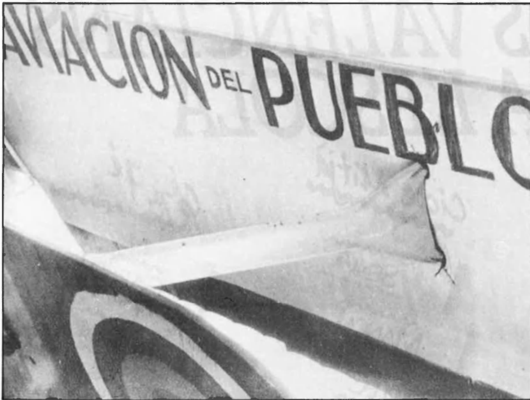
L'aviació que anuncià l'Olimpíada, transformada ràpidament en arma de combat.