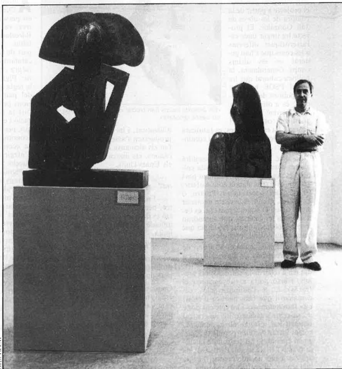
«Perdem identitat, també en les arts plàstiques».

—¿Hi ha pocs senyals d'identitat a València?