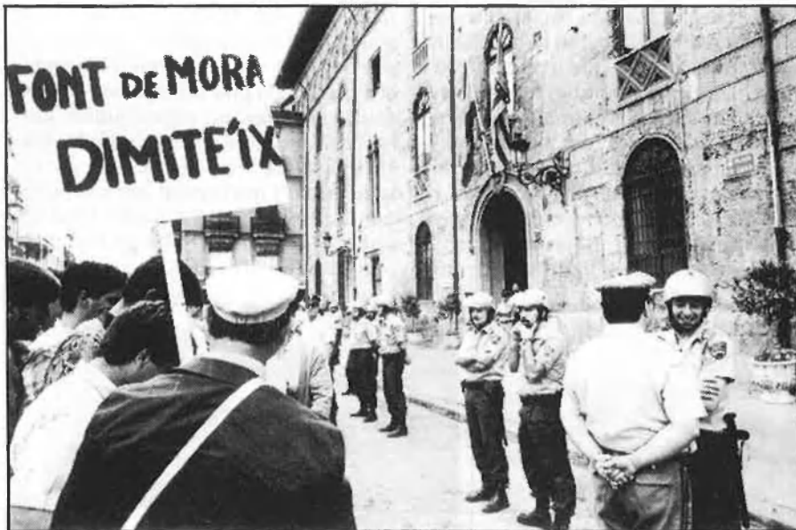
Un tema que desperta passions i irracionalitat.

noves transformacions de terres, la racionalització dels recursos i la modificació, no del tipus de cultiu (el taronger, majoritàriament), sinó del tipus de reg, amb el sistema de goteig, per exemple, han de ser algunes de les solucions».