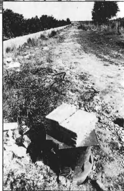
Dalt, protesta dels llauradors de Nules. Baix, el pou conflictiu.

«La majoria dels llauradors d'ací estem absolutament endeutats. Si la caixa venia a cobrar-nos avui, no ens trauria un duro».