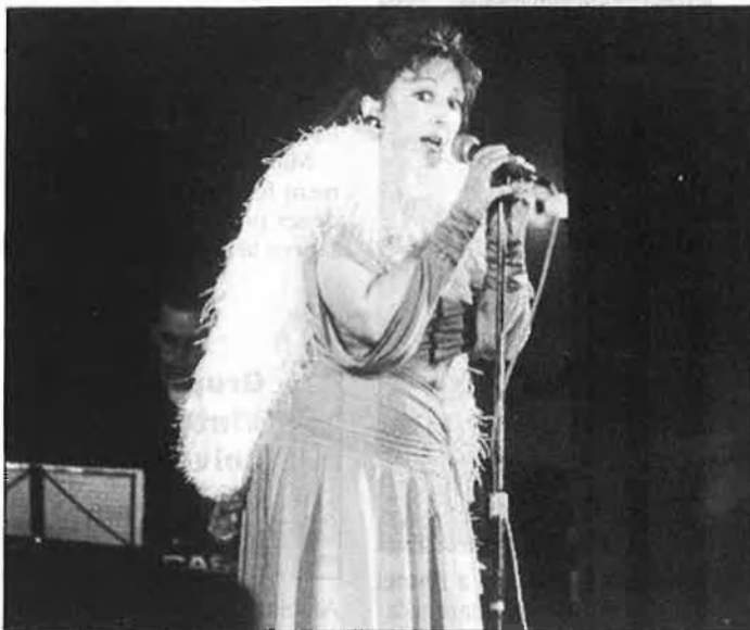
«Entre tots dos hi ha una simbiosi que no es dona amb els altres».