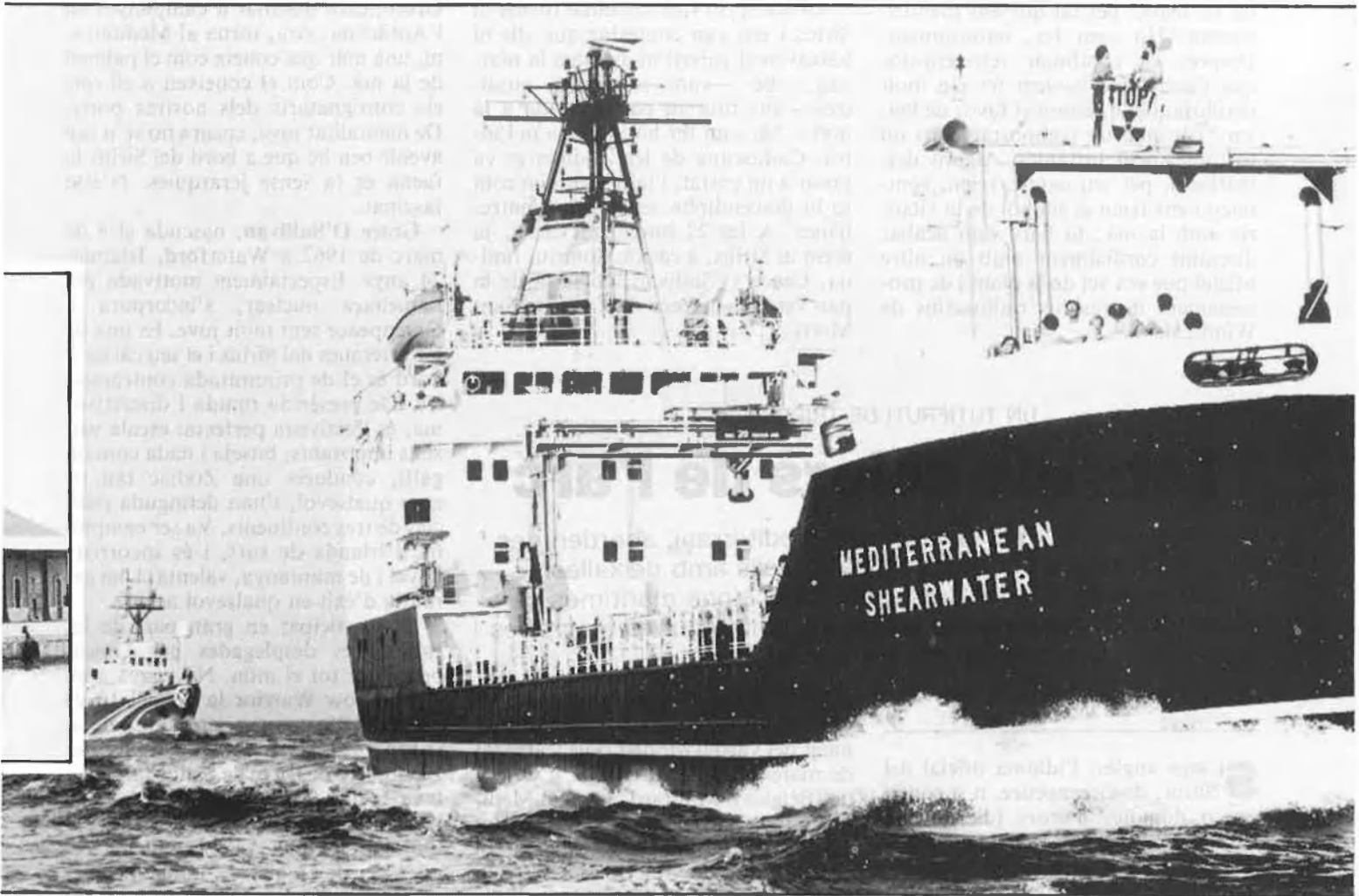
El Sirius es disposa a abordar el Mediterranean Shearwater.

Limited, va carregat amb 30 tones de material radioactiu, usat en alimentar el reactor Latina Magnox, Borgo Sabatino, a 20 km de Roma. Va salpar del port de Civitavecchia el 13 de maig amb un rumb habitual en la seua carta de navegació: Barrow (Gran Bretanya). Reprocessades en la planta que la mateixa companyia posseeix a Windscale Sellafeld, aquestes deixalles irradiades i revifades de plutoni tornaran, a bord del Shearwater, a Itàlia. D'ací seran traslladades a Creys-Malville per tal de fer de combustible del Superphoenix, reactor-dida d'aquesta central nuclear francesa. De Txornòbil flotant ha estat qualificat el Shearwater pels portaveus de Greenpeace.