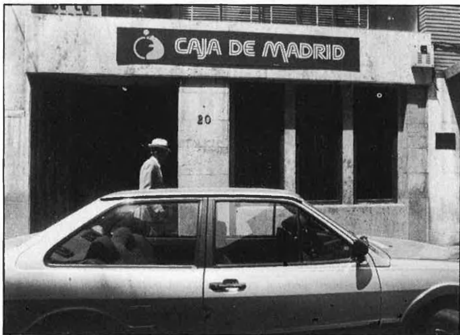
Caja Madrid, final de trajecte.